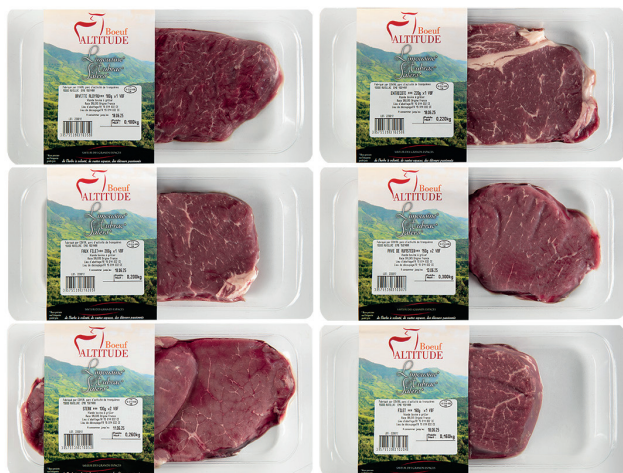
La nouvelle gamme de viande piécée Bœuf Altitude.