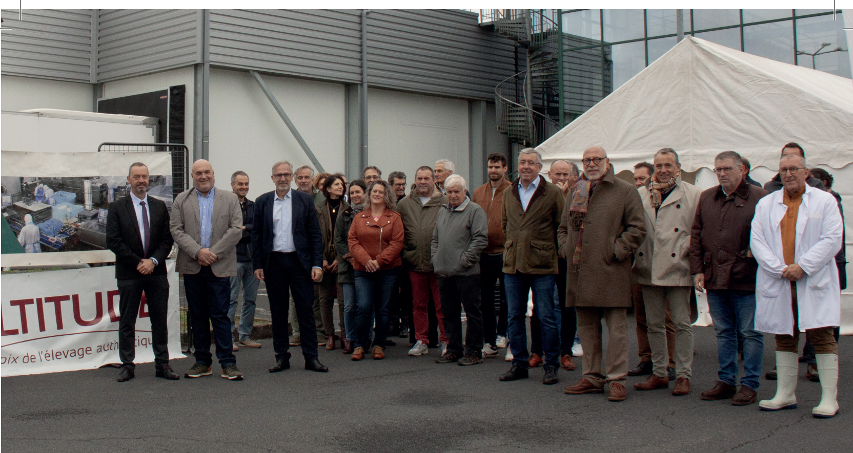
L'inauguration de l'atelier de piéçage de Civial s'est déroulée le 25 septembre en présence de M. le Préfet du Cantal, Philippe Loos.