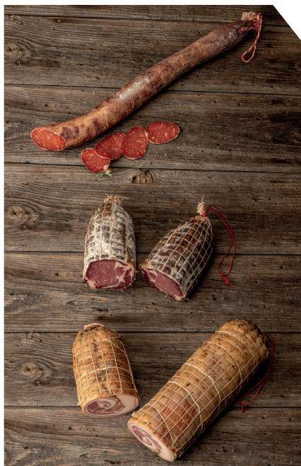
Chorizo, Pancetta, coppa : trois nouveaux produits proposés par la filière porcine aval Altitude