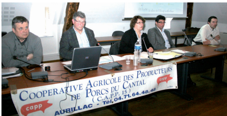
Les producteurs, quatre ans de crise qui marquent...

Le facteur déterminant a été à nouveau "l'augmentation des cours des matières premières qui ne me semble aujourd'hui guère réversible". Conséquence : "Nous n'avons pas d'autre alternative qu'une augmentation du prix de la viande et il faut aller vite car autrement, les producteurs vont perdre beaucoup d'argent malgré des mesures conjoncturelles appliquées par la coopérative pour les aider, telle une prime qualité passée de 9 à 16 centimes d'euros au kilo. Il ne faut cependant pas pour autant que les consommateurs s'affolent, car cette répercussion à la consommation ne serait que de 2 à 3 % mais il est important de trouver un équilibre."