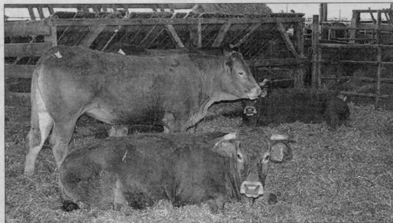
La station de Moussours perpétue sa vente de reproductrices limousines.

d'éleveurs et de professionnels note les vaches une à une et leur affecte un prix dans une fourchette définie au préalable qui tient compte des qualités de chaque animal (poids, caractère de race, développement, conformation mais aussi degré de gestation, qualités maternelles...)